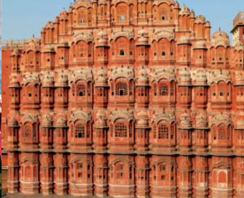
Alle Bilder dieses Folders sind urheberrechtlich geschützt.

Kumbalgarh Fort beinhaltet eine Vielzahl von Palästen, Tempeln und Monumenten, die im Laufe der Jahrhunderte hinzukamen. Weiterreise nach Udaipur (2 Nächte). (F)