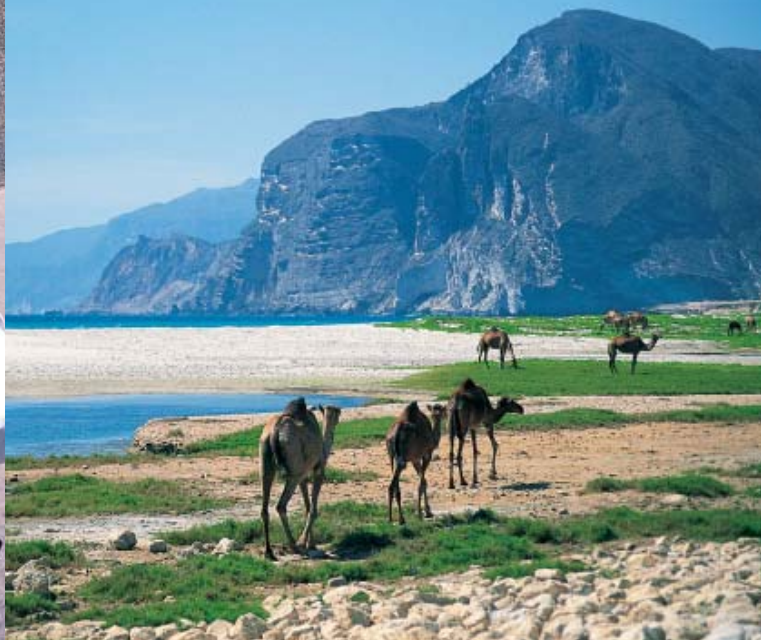
Alle Bilder dieses Folders sind urheberrechtlich geschützt.